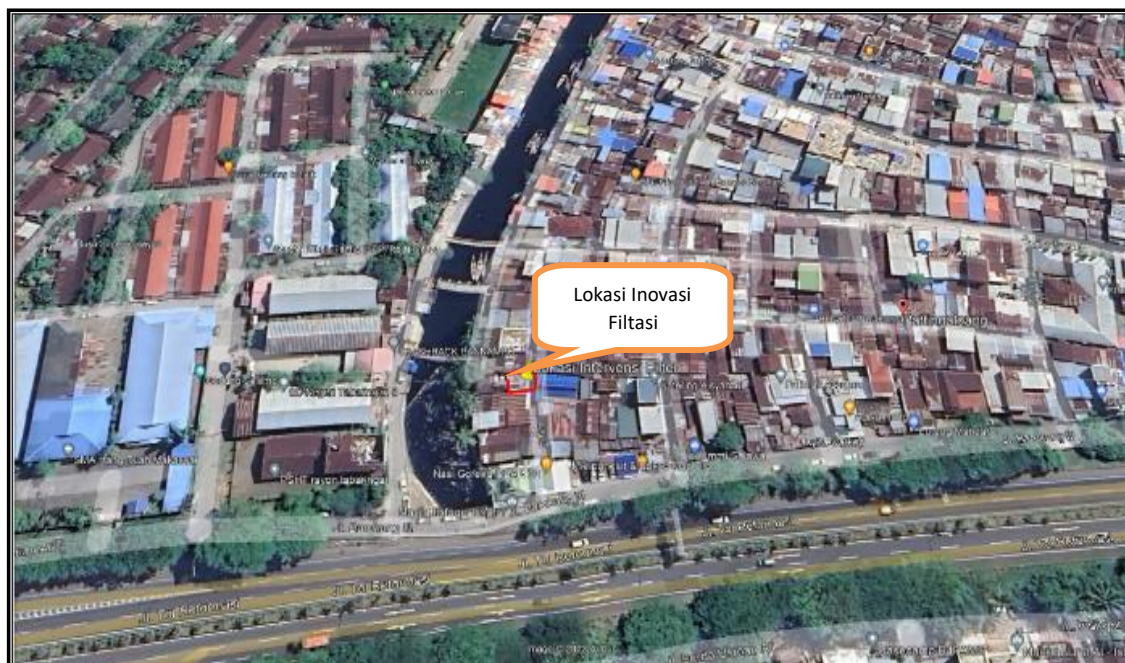
Gambar 1. Lokasi Pelaksanaan Kegiatan