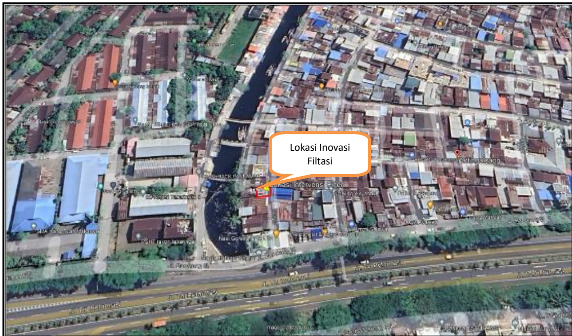
Gambar 1. Lokasi Pelaksanaan Kegiatan